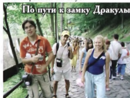
По пути к замку Дракулы

СОВЕТ 5. Пробуйте мамалыгу (национальное блюдо) маленькой ложечкой... она может быть совершенно разной на вкус.