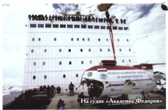
На судне «Академик Федоров»

У академика забавная мера исчисления финансовых потребностей большой науки - трансфертная стоимость футболиста. Забавное сравнение. Но в этом есть глубокий смысл. На футбол нам денег не жалко. На плохой футбол, приносящий стране