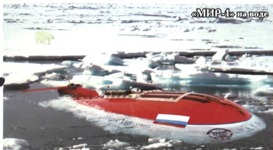
«МИР-1» на воде

- Скажите, вы со своими братьями о простых вещах говорите? Или только про механику многофазных систем? - Про жизнь и про механику. У нас тем для общения много. - Когда вы стали профессором МГУ, испытали восторг от достигнутого? - Я стал профессором в довольно молодом возрасте - в тридцать с небольшим лет. - Скажите мне, пожалуйста, вы двойки получали в школе или университете? - Было дело. - И это вызывало у вас страдания?