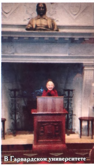
В Гарвардском университете