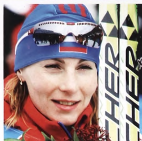
(Альбина Ахатова, олимпийская чемпионка по биатлону)

ТюмГУ на наше! С олимпиадами успехов в учебе! А. Ахатова