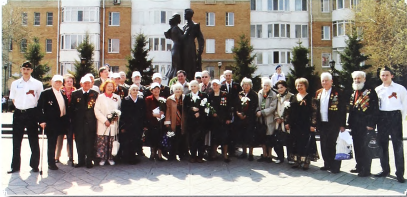
Встреча ветеранов ТюмГУ