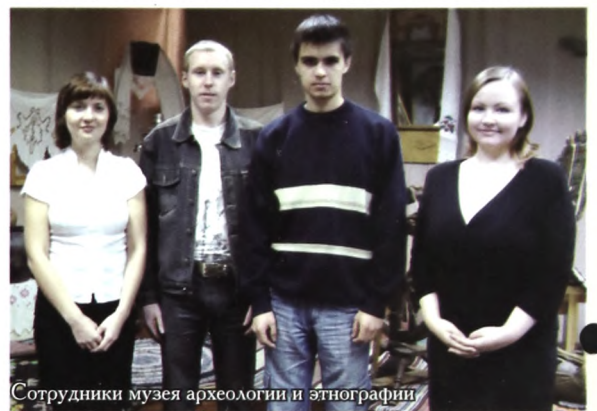
Сотрудники музея археологии и этнографии