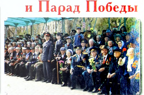
и Парад Победы