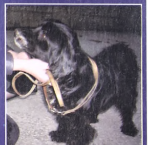
Метис спаниеля Лиза, больше 6 лет, покусанная собаками