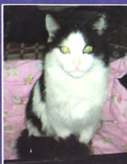
Кот Валик, около 3-х лет, кастрирован, ладит со всеми животными