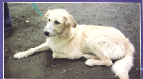
Метис лабрадора и терьера, девочка, стерилизована, 4 года.