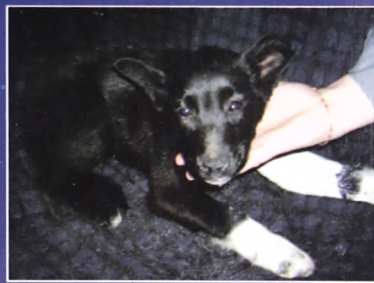
Собака Бяка, щенок, около 3-х месяцев, сломана лапа, будет большая