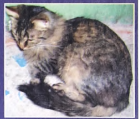
Сибирский кот, 1,5 года, кастрирован