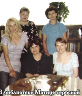
В библиотеке Матице сербской