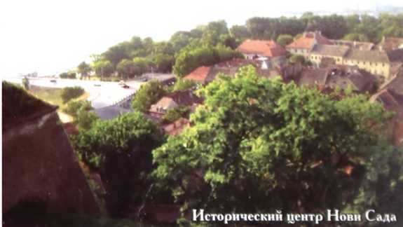
Исторический центр Нови Сада

К сожалению, приоритет, как в России, так и за рубежом, отдается романо-германской филологии, преимущественно английской. Однако, как считают многие ученые, без славянской, без духовных традиций и многовекового культурного наследия славянских народов, человечество очень скоро начнет морально вырождаться - задохнется от «Макдоналдов», рекламы блондинки в шоколаде