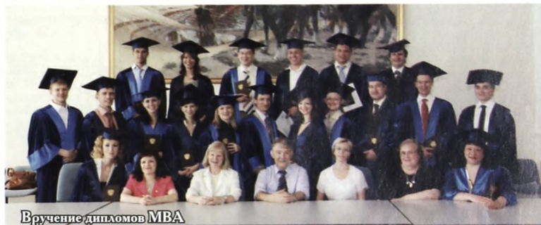
Вручение дипломов MBA

характера. Поэтому они отходят от таких форм обучения, как записи на лекциях и доклады на семинарах. Студенты получают готовые учебно-методические разработки, так называемые рабочие тетради, где уже изложен основной материал. А далее все обрабатывается на практике. Например, разбор проблемной статьи, деловые игры, ролевые игры, обыгрывание собрания акционеров и так далее. Это так называемые активные инновационные методы обучения.