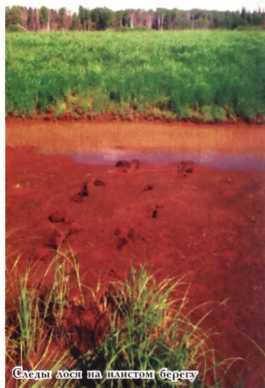
Следы лосей на каменистом берегу

шья. Из высокой травы поднялся лосенок, и они вместе с матерью, не спеша, удалились в сторону зарослей вьюнка. Вот так удача - в первый же день увидеть лося с лосенком, да еще так близко. Других лосей в тот день нам встретить не довелось, но зато на берегу небольшого озера мы обнаружили свежие погрызы бобров, которых раньше в заказнике не отмечали. По пути неоднократно попадались лежки лосей, которые свидетельствовали о высокой плотности этого зверя в заказнике. На другой день нам повезло еще больше - мы встретили в разных местах двух лосих, причем одна из них была с двумя лосятами. В бинокль можно было рассмотреть этих длинноногих малышей, которые уже довольно быстро следовали за матерью. На третий день - снова лосиха и опять с двумя лосятами. Утомленные полуденным зноем и слезными, которые кружились над их головами, лосиха и лосята стояли по горло в воде. Как мы им позавидовали, что у них нет одежды и сапог - зашел в воду, вышел и просто отряхнулся. На реках Захребетной, Тамбазанке и Боровой встречались многочисленные следы лосей, переплывавших их в поисках сочной травы. Настоящий лосиный родильный дом - обильный корм, отсутствие волков и браконьеров сделали это место идеальным для отела лосих и воспитания молодняка. Высокая плотность лосей в заказнике поддерживается благодаря