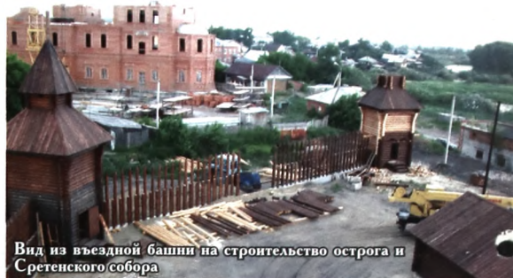
Вид из въездной башни на строительство острога и Сретенского собора