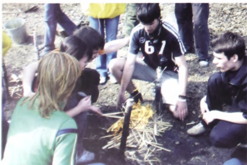
Усеем разводить костёр