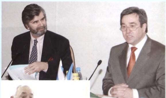
С послом Франции Станисласом де Лабале