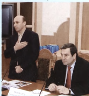
С вице-губернатором С. Сарычевым