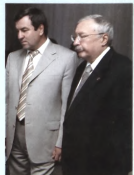
С членом Конституционного суда М. Клеандровым