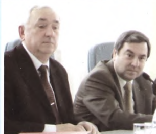
С членом Совета Федерации С. Киричуком