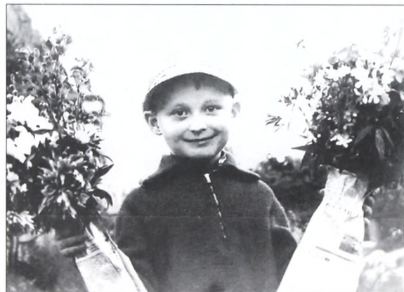
Автор статьи, 31 августа 1968 г.