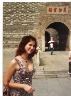
Вход в храм Конфу

Изначально в голове был полный кавардак - новые слова, непонятно, как читать, совсем иная фонетика, крutom все говорят на китайском. Но сейчас потихоньку все укладывается. Дальше будет еще лучше. Обещаю.