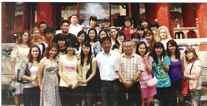
Мы все в храме Конфу

все на велосипедах, мотоциклах или мотовелосипедах. Транспорт имеют почти все, от мала до велика. И нередко можно встретить как малыша, рассекающего пространство городка на велике (есть даже поговорка «китайцы рождаются на велосипеде»), так и весьма пожилых людей, беззаботно и совсем без напряжения крутящих педали. Но о велосипедах подробнее расскажу позже.