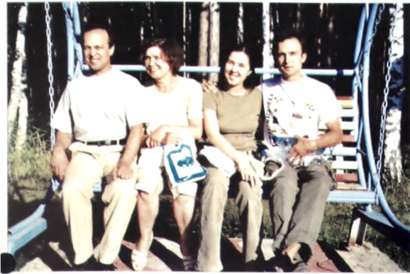
С мужем и детьми