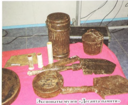
Экспонаты музея «Десанта памяти»

О том, как нелегка работа поисковика, рассказывает открывшаяся в ЦМ корпусе ТюмГУ фотовыставка «Неоконченная война».