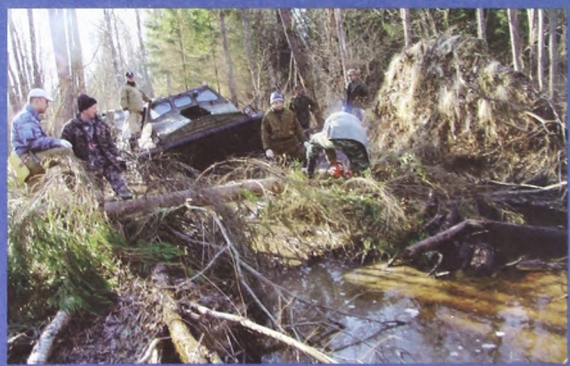
На пути к месту раскопок