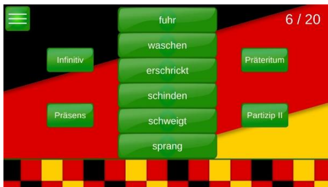
Рис. 4. Приложение «Карточки немецкого языка», тест на соответствие

«Карточки немецкого языка» [10] — приложение, которое строится на работе в режиме карточек: пользователь просматривает слово на немецком языке и его перевод на русский. С помощью данного приложения пользователь знакомится главным образом с базовыми глаголами, существительными и выражениями немецкого языка, а также может пройти тесты на соответствие глаголов по временам и на перевод слова. Данное приложение подойдет для широкого круга начинающих изучать язык. Интерфейс на русском языке. Приложение не работает в офлайн-режиме, нет платной версии. Количество скачиваний более 5000, средняя оценка — 4,5, объем — 11,16 Мб.