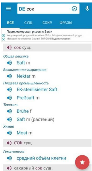
Рис. 2. Приложение «Мультитран», главный экран

«Мультитран» [8] — переводчик со следующими функциями: голосовой ввод, прослушивание слов, просмотр транскрипции, добавление слов в избранное, просмотр истории. Данный переводчик имеет множество вариантов переводов слов — не только общепринятые, но и профессиональные (специальные) и редкие переводы слов. Приложение подходит для широкого круга пользователей с разным языковым уровнем. Перевод осуществляется на 17 языков — английский, немецкий, французский, испанский, итальянский, нидерландский, латинский, эстонский, эсперанто, африкаанс, калмыцкий, греческий, китайский, норвежский, польский, шведский, японский, русский. Количество словоформ в данном словаре составляет 400 000. Язык интерфейса русский. В офлайн-режиме просматриваются только слова, добавленные пользователем. Имеется платная версия. Количество скачиваний на Play Маркете более 500 000, средняя оценка пользователей — 4,8, объем — 2,40 Мб.