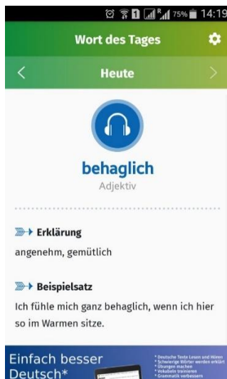
Рис. 1. Приложение «Wort des Tages: Deutsch — Vokabeln lernen», главный экран

«Wort des Tages: Deutsch — Vokabeln lernen» [7] — это приложение, в котором каждый день изучается новое слово. Оно имеет функции прослушивания слова / словосочетания с опорой на текстовый вариант. Также к слову дается объяснение (семантизация на немецком, например, путем приведения синонимов), предлагается пример предложения, где используется данное слово, который озвучивается носителем языка. Также можно знакомиться со словами, которые приводились ранее. Настройки позволяют установить push-уведомления. Данное приложение предназначено для широкого круга пользователей, расширяющих свой словарный запас с языковым уровнем от A1 до C1. Приложение не работает в офлайн-режиме.