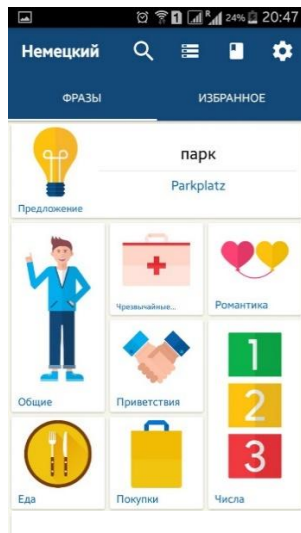
Рис. 5. Приложение «Изучайте немецкий язык — Разговорник/Переводчик», раздел «Фразы»

В нашей работе была поставлена цель — исследовать мобильные приложения для обучения иностранному языку с точки зрения функций и рассмотреть их типологию. В ходе анализа рынка мобильных приложений для изучения языков мы увидели возрастающий интерес к подобным приложениям, так как их количество растет. Из этого становится очевидно, что информационные техно-