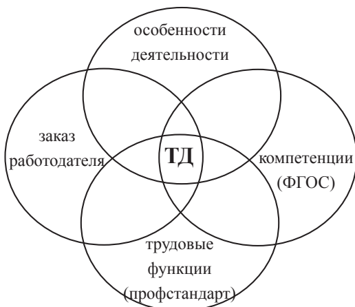
Рис. 1. Процедура выделения трудовых действий

Схематично процесс выделения трудовых действий можно обозначить в следующей организационной диаграмме (рисунок 1). Трудовые действия, которые составляют ядро диаграммы, выделяются на основе соотношения требований профессионального стандарта, федерального государственного образовательного стандарта, особенностей деятельности, профессиональных требований (запросов работодателей).