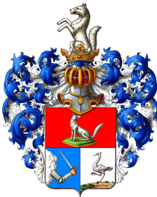
Рис. 3. Герб рода Рейнеке [3]