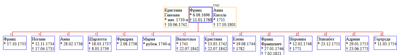
Рис. 2. Рейнеке: древо рода [9]