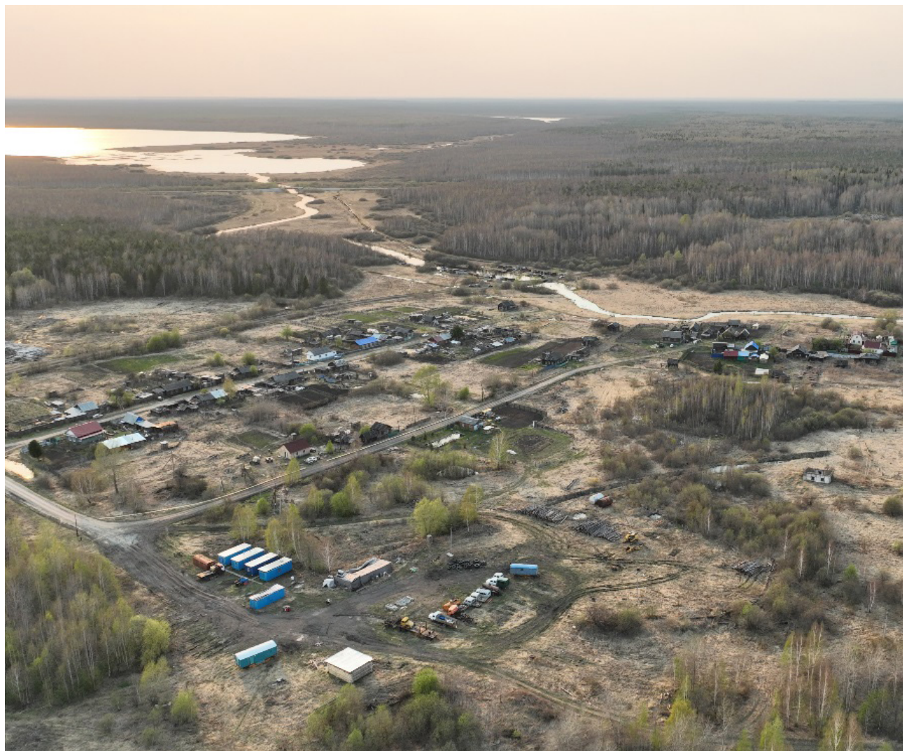
Рис. 1. Вид с высоты птичьего полета на бывшую д. Нефедьева