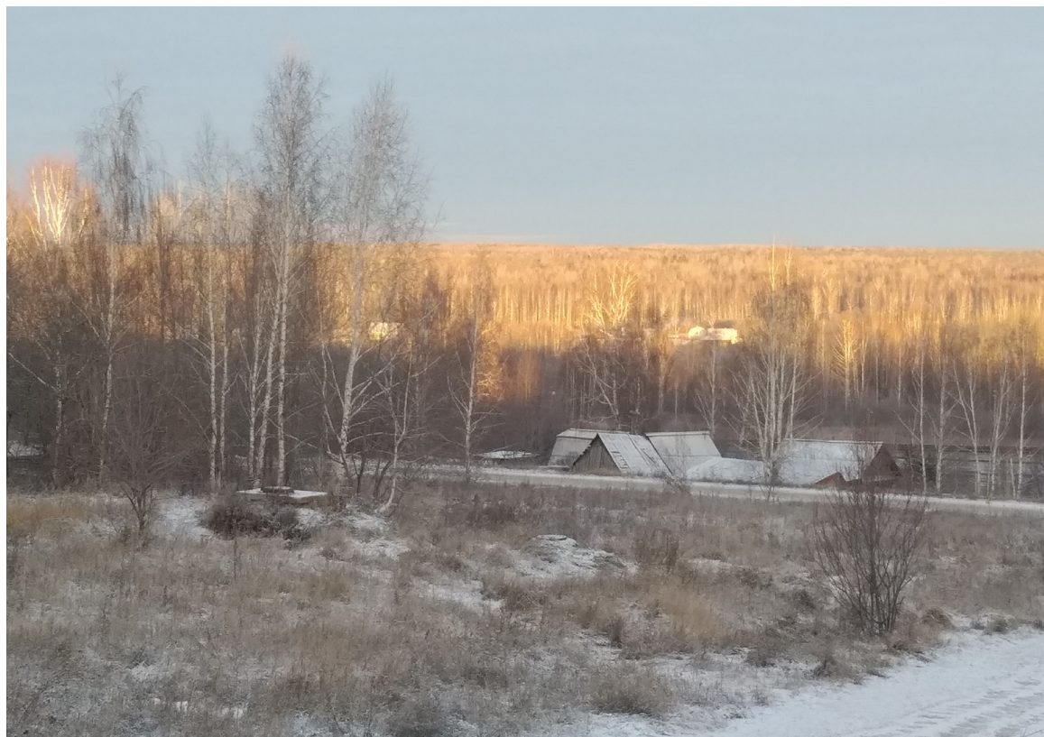
Рис. 3. Вид со «шведской» горы на бывшую д. Нефедьева

еще и заготовливали сено для колхоза по плану, зимой его увозили в д. Елань. За трудодни в колхозе жителям давали пшеницу. Приезжал рыболовецкий колхоз, и мужчины занимались заготовкой рыбы. В свободное от работы время охотились. Иногда деревню посещали цыгане и старьевщики, которые скупали старые вещи. В каждом дворе имелся огород. Воду для полива носили с речки. Леек в то время еще не было, и поливали посадки из ведра через березовый веник. Многие жители занимались пчеловодством, у некоторых даже были медогонки. Дети помогали по хозяйству, гребли сено, делали игрушки из дерева.