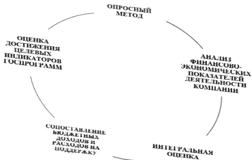
Рис. 1. Подходы к оценке системы эффективности государственной поддержки МСП

Анализ научных публикаций позволил выявить различные подходы к оценке системы эффективности государственной поддержки МСП (рис. 1).