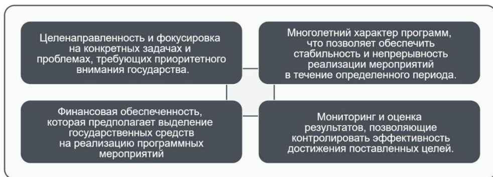
Рис. 2. Основные аспекты Федеральных целевых программ