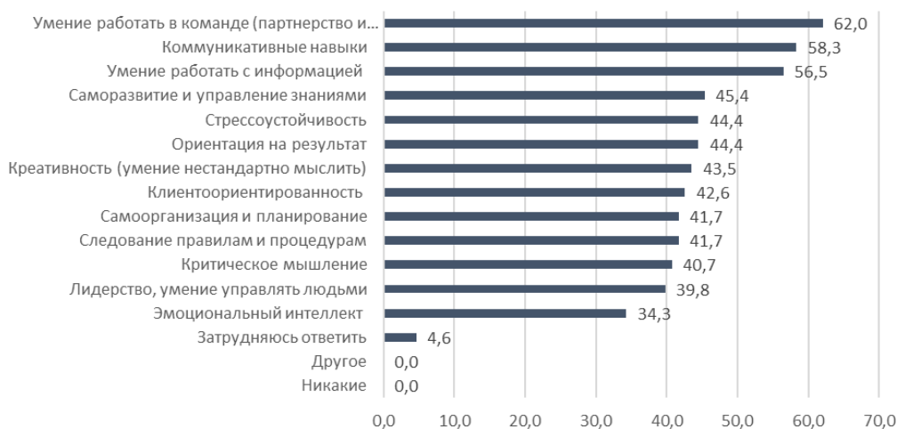
Рис. 2. Ответы студентов, обучающихся в РГЭУ (РИНХ), на вопрос о том, какие «мягкие» навыки есть возможность приобрести во время обучения в вузе, %

Результаты анализа возможностей вуза, в котором студенты проходят обучение, относительно перечня «мягких» навыков специалиста в сфере финансов, указаны на рис. 2.