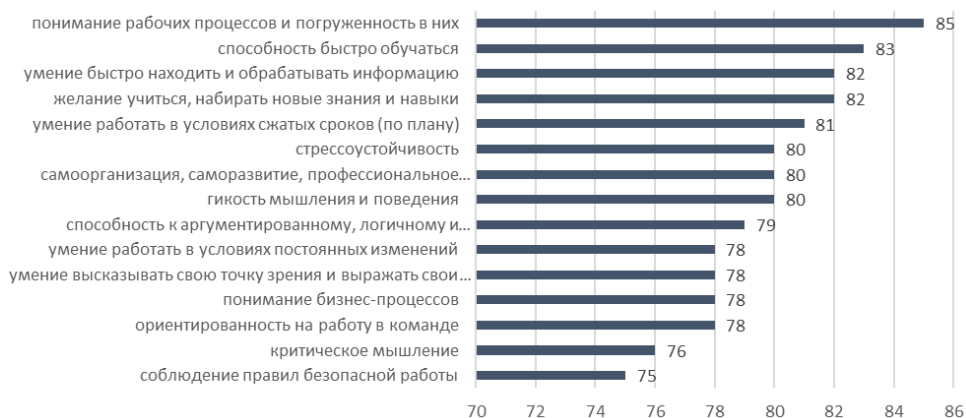
Рис. 3. Мнения работодателей о значимых мягких навыках специалистов на финансовом рынке, %