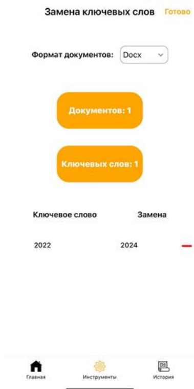
Рис. 2. Экран замены ключевых слов

Результаты. В результате проведенной работы было разработано мобильное приложение для обработки содержимого документов. Приложение имеет интуитивно понятный интерфейс и предоставляет возможность сканировать, редактировать, заменять ключевые слова в документах и конвертировать документы в различные форматы.