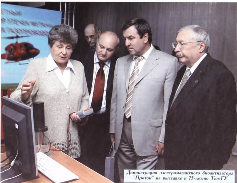
Демонстрация электромагнитного биоактиватора "Протон" на выставке к 75-летию ТюмГУ