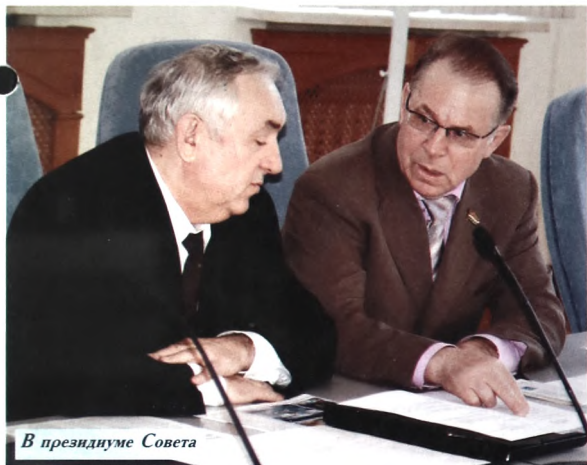
В президиуме Совета