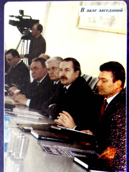
В зале заседаний