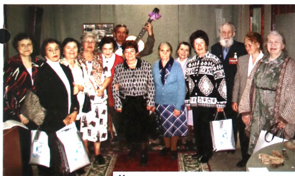
Члены совета ветеранов и дарители музея