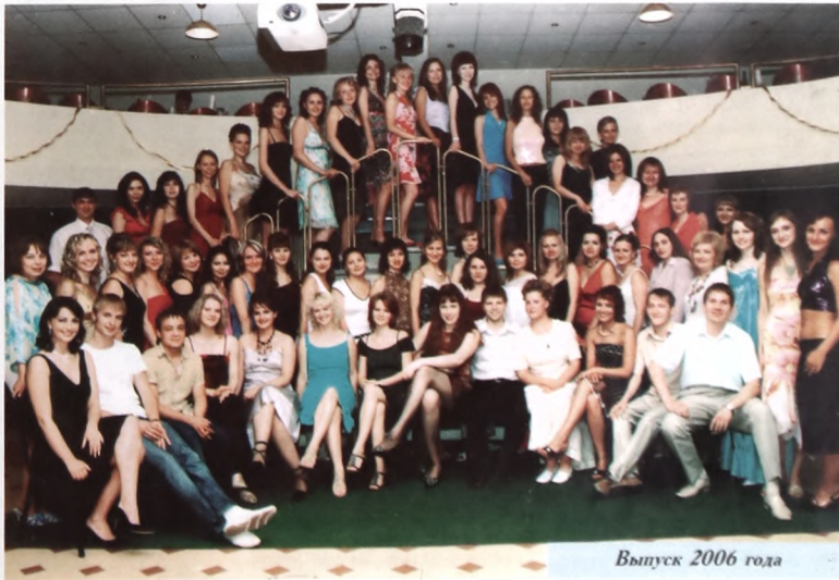
Выпуск 2006 года