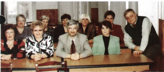
Встреча выпускников, 25 лет со дня окончания университета