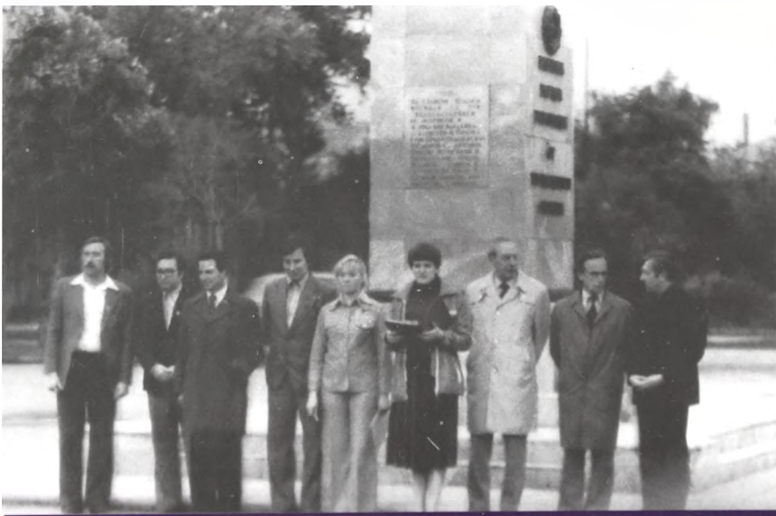
Открытие трудового лета студентов ТюмГУ. Торжественная линейка

В соответствии с Уставом студенческого отряда руководство жизнью и деятельностью линейного отряда осуществлял штаб, который утверждался комитетом комсомола учебного заведения, формирующего отряд. В состав штаба входили: командир, комиссар, мастер, медицинский работник, бригадиры и общественный инспектор по охране труда. Руководители отряда подбирались комитетом комсомола и ректоратом учебного заведения из числа комсомольских и профсоюзных активистов, обладавших необходимыми знаниями, авторитетом и имевших практический опыт организаторской работы. Штаб линейного отряда возглавлялся командиром, который назначался комитетом комсомола и ректоратом учебного заведения. Он нес персональную ответственность перед комсомольской организацией и ректоратом за производственную, идейно-вос-