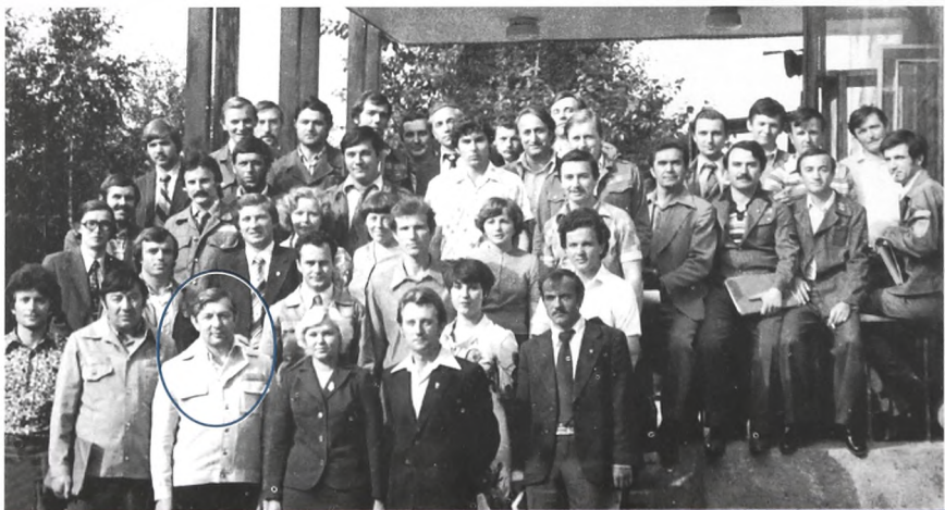
Совещание главных инженеров зональных штабов ССО, 1981 г.