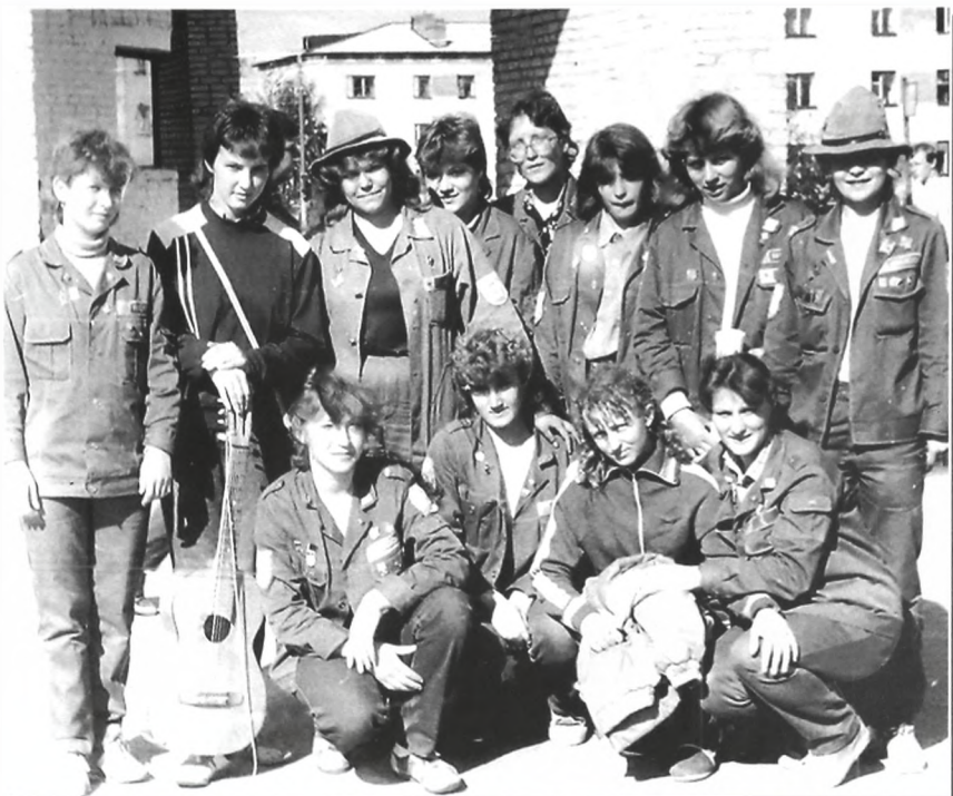
ССО "Импульс", 1985 г., пос. Советский Тюменской области

А вообще-то все от души шло. Деньги были на втором месте. На всю жизнь запомнилось тепло общения. Ведь рядом - 20 других отрядов со всей необъятной территории СССР. И среди них - только один наш женский отряд. Особенно сильно запомнился ребята-белорусы из Минска, хлопцы из Одессы. Специально для них мы взяли с собой разноцветные красивые значки с тюменской символикой, а они нам дарили свои... Но мы были хоть и общительными, но серьезными девушками. Только одна из нас не