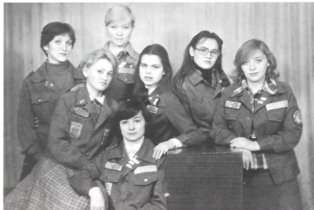
ССО "Надежда", 1978 г.

Сейчас у нас небольшой привал: до студенческого трудового лета есть еще время, и мы можем поговорить с тобой о многом. Может, порой запальчиво, горячо, но - откровенно. Ведь главное в разговоре - доверие. Для нас, бойцов ССО, взаимная помощь, совет стали воздухом. Мы не все еще успели сделать, но ведь дорога у нас продолжается, значит - в добрый путь, стройотрядовец!