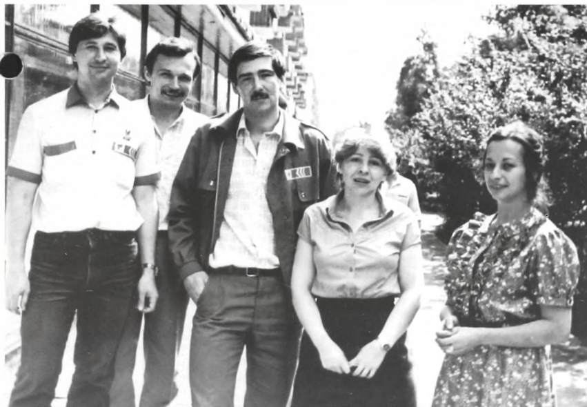
Автор этих строк (справа) и руководство штаба ССО

Потом была работа в студенческом отряде проводников. Это интересно, красиво, в меру романтично. Но все равно хотелось в тайгу. В университете было всего два стопроцентных строительных отряда - "ЮрССО" и "Импульс". Но туда девочек практически не брали. Кажется, на два места - врача и повара - конкурс был просто фантастический. Так что мой практический опыт работы в студотряде исчерпывается двумя важными должностями - комиссара, а потом и командира студенческого отряда проводников.