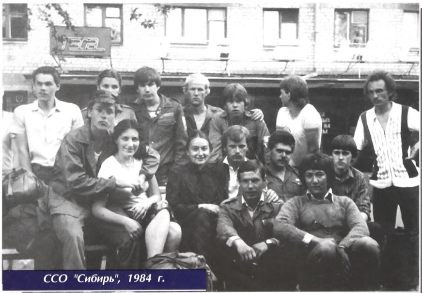
ССО "Сибирь", 1984 г.

День приезда запомнился сопровождением от самого аэропорта огромной тучи кровососов. Боже мой, да когда же они наконец отстанут! Рабочую одежду выдали. Явно не для стройных студенток - минимальный размер пятидесятый! А сапоги... Да их же только вместе с кроссовками можно надеть! А тут еще грязь по колено... На двух улицах глухого по-