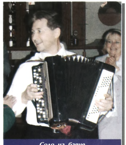
Соло на баяне

треста "Нефтеюганскгазстрой", СУ-3 треста "Надымнефтегазжилстрой", СМУ-1 ПСМО "Уренгойгазстрой", подразделения "Тюменьагропромстрой"), использование отрядов на второстепенных объектах (СУ-9 треста "Новоуренгойгазстрой", КМСУОР треста "Уренгойгазстрой") не позволяют в отрядах шире применять прогрессивные методы организации труда и полностью реализовать имеющиеся возможности.