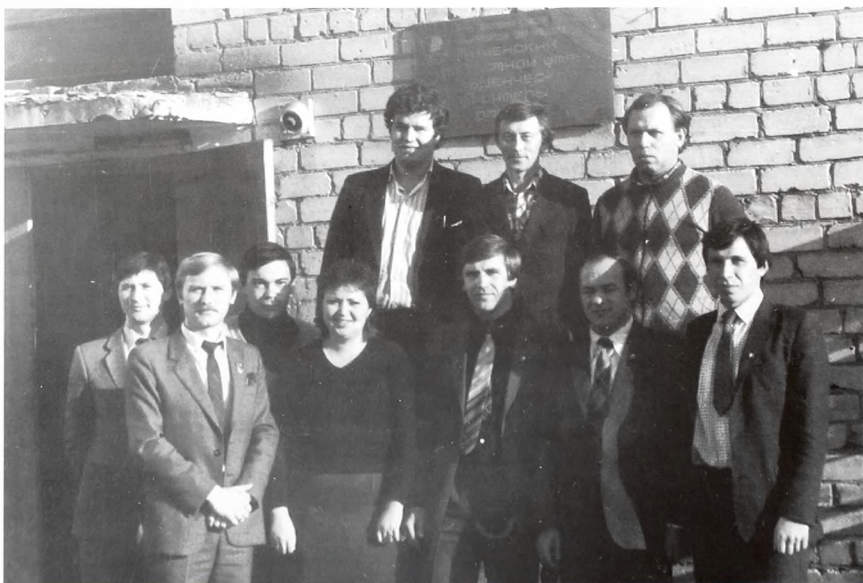
С друзьями на учебе

...II. Производственная деятельность Итоги третьего трудового семестра 1987г. показали, что основной формой организации труда отрядов была работа по коллективной сдельно-премиальной оплате, этой формой было охвачено 48% отрядов. Снизилось количество отрядов, работавших по методу бригадного подряда - 3% отрядов. Основной причиной снижения является переход многих принимающих организаций на новую форму хозяйственного расчета - метод коллективного подряда. Процент охвата отрядов передовыми методами организации труда (51%) показывает на серьезные недоработки как формирующих штабов, так и Тюменского областного штаба. Слабая подготовка руководящего состава отрядов, неготовность многих принимающих организаций обеспечить отряды договорными объектами, расчленение отрядов на бригады для работы на разных объектах (СУ-10