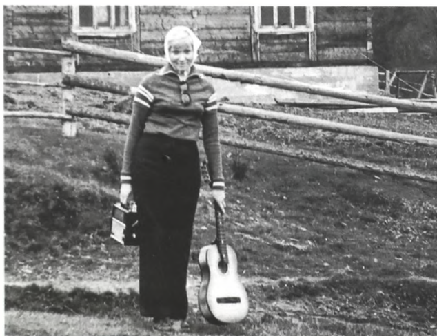
У друзей в Закарпатье