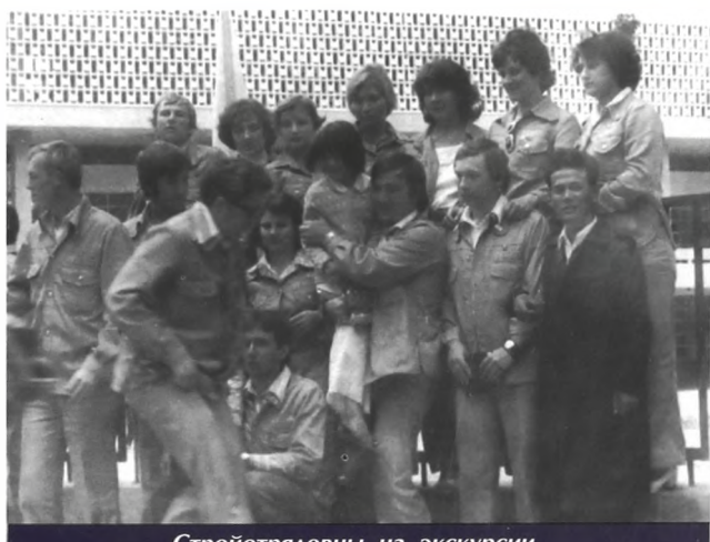
Стройотрядовцы на экскурсии. Ханой. Дворец пионеров, 1977 г.