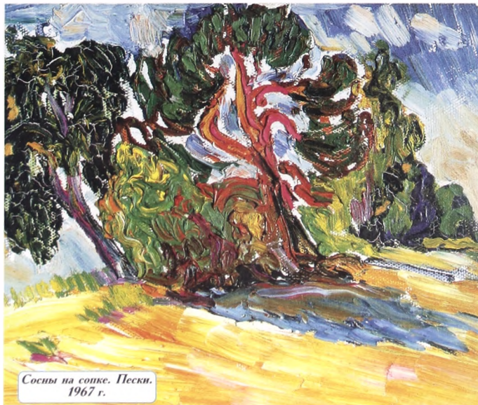
Сосны на сопке. Пески. 1967 г.

...Меня называют авангардистом, примитивистом или пытаются поместить еще в какой-нибудь из "блоков". На это я отвечаю: личность вещает все... Только пройдя весь круг, можно обнаружить богатство возможностей. У меня нет разделения на реальное, абстрактное, ибо я вижу: это все есть в разных традициях жизни".