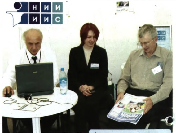
Рабочие моменты конференции

- И познавательные, и обучающие, и исследовательские. Когда касс много, кассиры работают с разной производительностью, по-