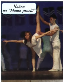
Чайки из "Ното проели"