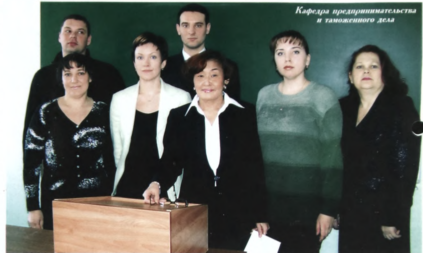
Кафедра предпринимательства и таможенного дела