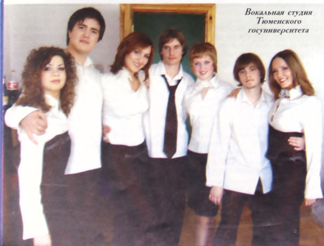
Вокальная студия Тюменского госуниверситета

В.Путин: "Воспитание школьников - это важнейшая часть работы педагога"