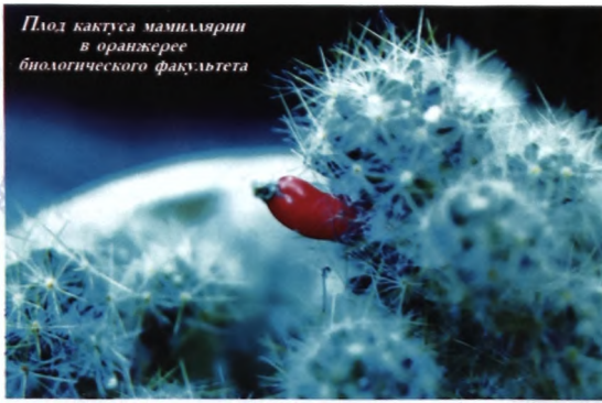
Плод кактуса мамиллярии в оранжерее биологического факультета

которых кактусов обладает общеукрепляющим и тонизирующим действием, положительно влияет на обмен веществ. Однако с лечебной целью кактусы нужно употреблять осторожно, так как неправильное их применение может вызвать тяжелые расстройства речи и памяти, зрительные и слуховые галлюцинации.