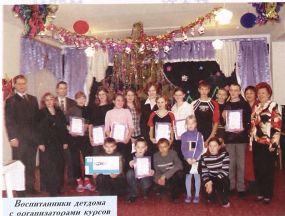
Воспитанники детдома с организаторами курсов