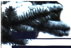
ОЛЬГА КОВАЛЕНКО по материалам Интернета