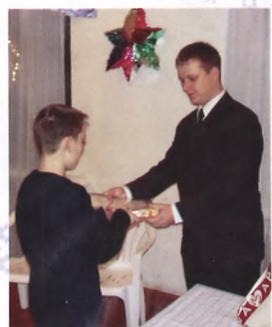
Вручение сертификата и новогоднего подарка.

Технология обучения компьютерной грамотности у данного центра своя, авторская. Она не остав-