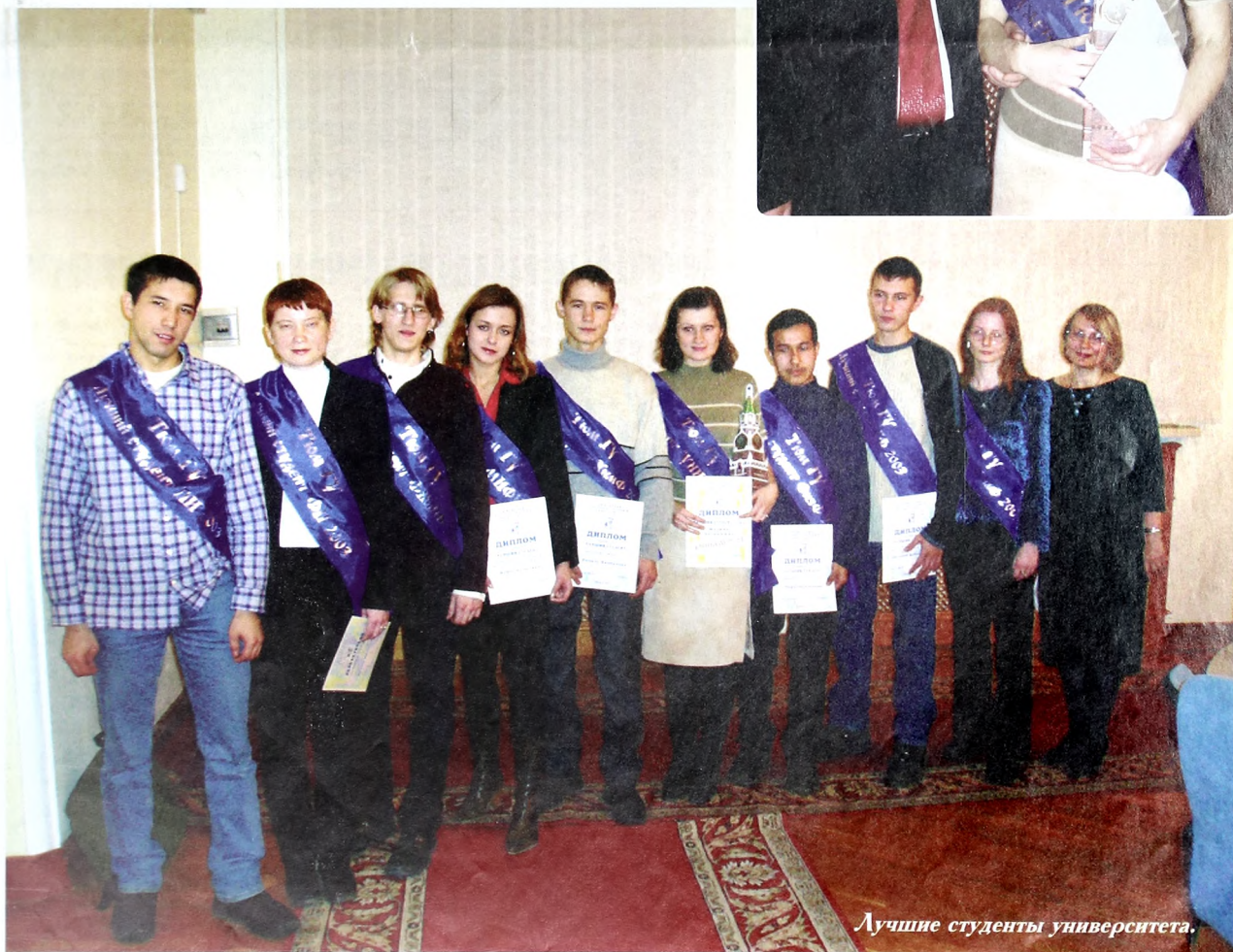
Лучшие студенты университета.