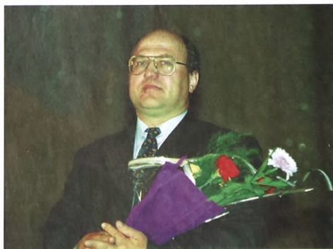
университет и специализировался в этом направлении, сегодня уже работают в туристич-

Эта специальность сегодня на острие времени, потому что идет процесс всеобщей информатизации и компьютеризации. Но мы выбрали пока две специализации: "Земельный кадастр" и "Городской кадастр". По этим специальностям сейчас ведут подготовку нефтегазовый университет (индустриальный кадастр), архитектурно-строительная (городской кадастр) и сельскохозяйственная академии (кадастр сельскохозяйственных земель). В чем то мы с ними пересекаемся, но специфика подготовки наших студентов будет заключаться в большем упоре на геоинформационный аспект. Я встретился с руководителем городского комитета по земельным ресурсам, и мы с ним подчитали, что сегодня существует около 500 вакансий.