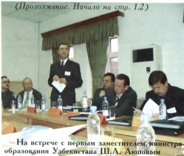
На встрече с первым заместителем министра образования Узбекистана Ш.А. Алоповым

Несколько слов о совещании в Министерстве образования Узбекистана. Были представлены многие вузы, занимающиеся дистанционным образованием, в частности Великобритания, США, Израиль, Россия. Тюменский государственный университет выд-