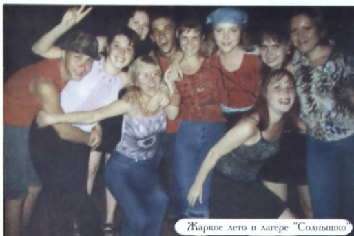
Жаркое лето в лагере "Солнышко"

клуба ТюмГУ, тренер и организатор команды "Веселые извилины", была и капитаном, но из-за своих разно-