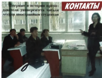
Впервые в истории преподаватели университета читали лекции иностранным студентам

Еще одна идея - создание открытого университета Узбекистана. Дело в том, что сейчас в России активно обсуждается проект по созданию межвузовского центра дистанционного образования, в том числе и с нашим участием. В свою очередь межвузовский центр ДО примет участие в проекте открытого университета Узбекистана. Согласно учебные планы и программы, приведем их в соответствие с Болоинской декларацией. Но, самое интересное, впервые в феврале наши преподаватели начали читать лекции студентам, которые живут за рубежом. Сейчас все-таки отношения между нашими странами остаются достаточно слож-