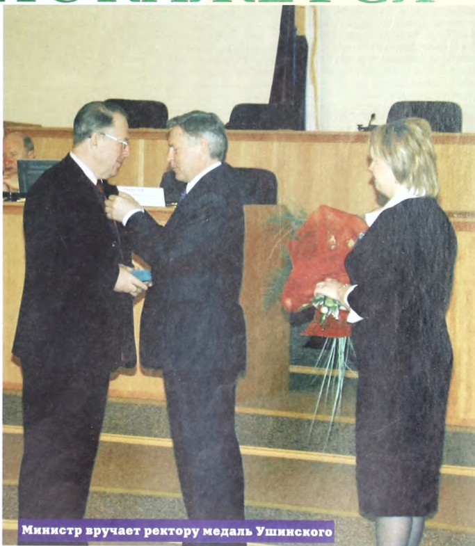
Министр вручает ректору медаль Ушинского