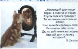
Глаза дружки редко оциантуются.

мероприятий, а психологом - на уроках развития. Родители могут найти информацию о том, как помочь своему ребенку наладить хорошие отношения с друзьями. Большое внимание уделено вопросам здоровья, поскольку оно является неотъемлемой частью "дружбы человека со своим организмом".