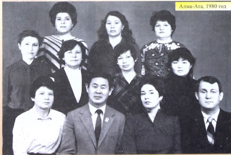
Алма-Ата, 1980 год

- В Ленинграде мне сразу сказали: если не возражаешь, мы хотели бы, чтобы ты работал у нас. Вернулся в Алма-Ату, окончила университет, и на меня прислали запрос из Ленинграда. Это был первый случай в университете, когда запрос пришел из Ленинграда. Меня зачислили на должность младшего научного сотрудника, а осенью уже поступил в аспирантуру. Окончил ее, защитил диссертацию. Вот тогда мне предложили несколько мест работы, даже должность заведующего лабораторией в Пскове. Я мог и раньше оказаться в Тюмени, когда директор тюменского института "СибирьНИИПроект" приехал в Ленинград со своим аспирантом. Мы встретились, и он предложил мне должность заведующего свердловским отделением института с предостережением квартиры. Я согласился. Но заявку на меня написал на должность младшего научного сотрудника в Тюмень. Я тогда отказался. Как раз поступило приглашение из