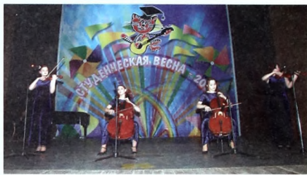
Ансамбль "Лири" - ЛАУРЕАТЫ в номинации "Разножанровые инструментальные группы"