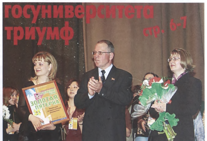
Команда Тюменского государственного университета - ЛУЧШАЯ в ЗОЛОТОЙ ПЯТЕРКЕ ВУЗОВ ОБЛАСТИ!