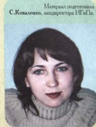
Материал подготовила С.Коваленко , замдиректора ИПиПа.

Надеемся, что автолюбители отнесутся серьезно к своей обязанности по страхованию автогражданской ответственности, и желаем всем счастливого пути.