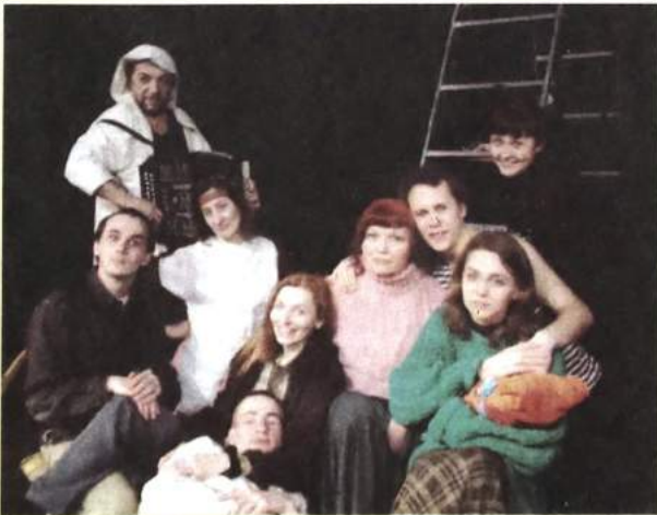
"Очень простая история"