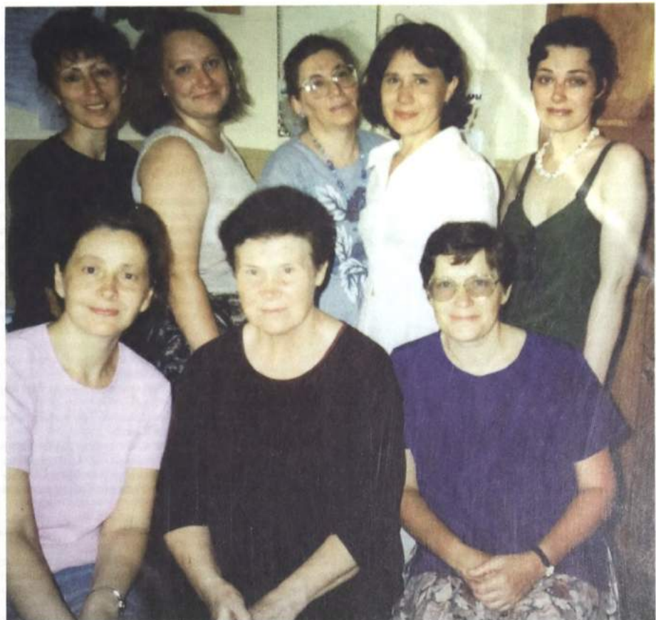
Сотрудники кафедры иностранной литературы.

Тогда я предложила взглянуть на эту проблему шире - задуматься о развитии гуманитарного образования в нашей области вообще. В Тобольском пединституте открылся факультет иностранных языков с подготовкой учителя двух иностранных языков, открылся его филиал в Нижневартовске. Советам наших вузов в содружестве с облоно было необходимо изучить спрос на учителей-филологов