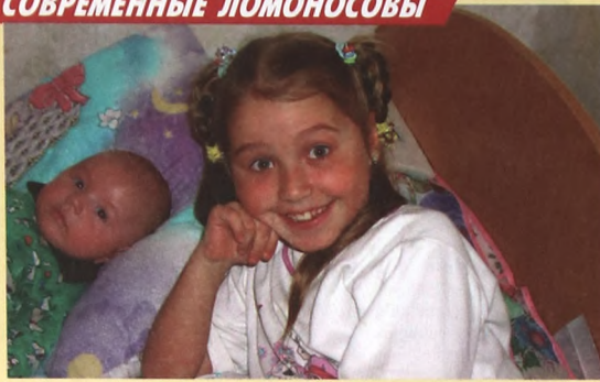
"Я очень хочу стать учителем начальных классов", - нежным голосом, щем непременно похожими на нее, свою первую учительницу - неумолимую, за-