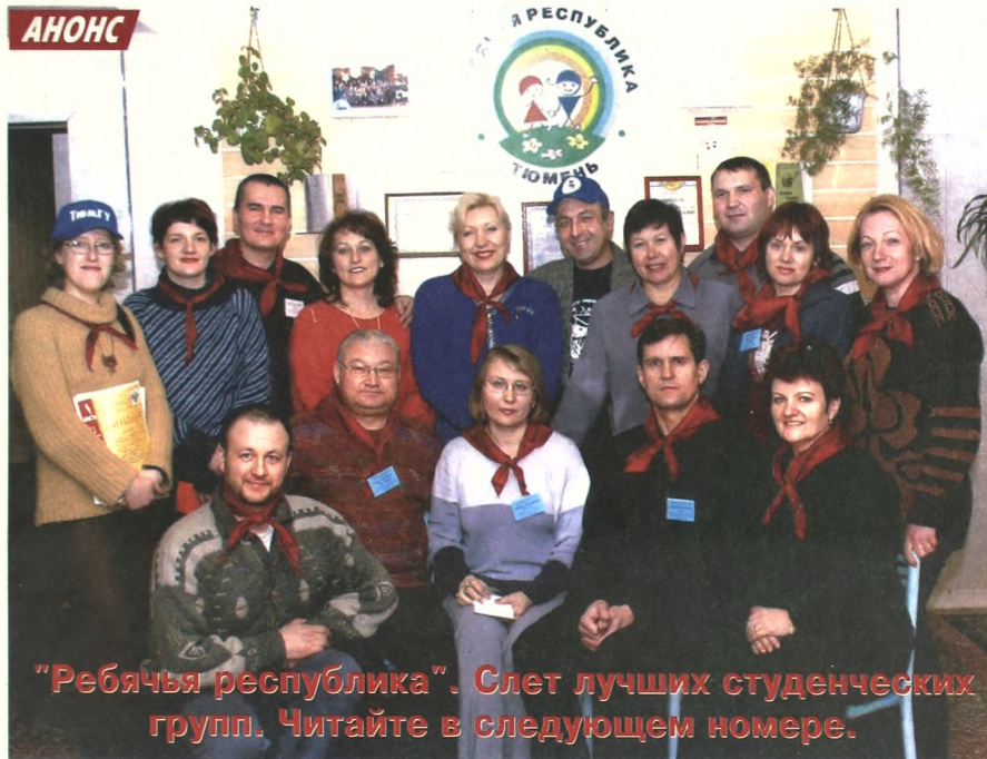
"Ребятчья республика". Слет лучших студенческих групп. Читайте в следующем номере.