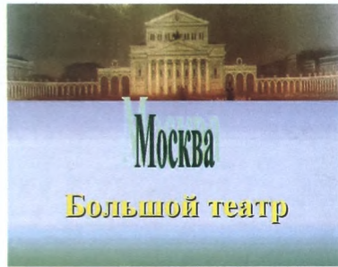
Москва Большой театр

Презентация, посвященная Большому театру России, представляет собой разработку отдельных