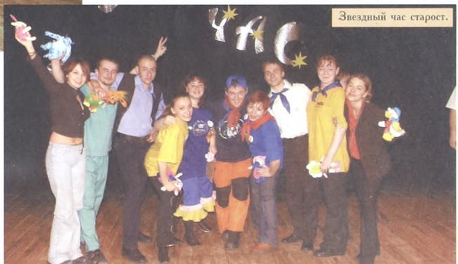
Звездный час старост.

- Наше кодовое название "Тобольский Питер". Все говорят, что наша сборная команда приехала из Санкт-Петербурга. Но это всё ложь и провокация. Мы из Тобольска. Выиграли конкурс внутри вуза, потому что самая дружная команда. Мы самое сильное звено! У нас разные увлечения и интересы: поем, танцуем, занимаемся спортом, ездим на фестивали. У нас в группе целая команда "Что? Где? Когда?", которая выезжает на областные, российские интеллектуальные игры. А еще мы занимаемся наукой, участвуем в научно-практических конференциях, занимаем призовые места. Еще среди нас есть почетный археолог, два депутата Тобольского молодежного парламента и даже сам председатель молодежного парламента. Кроме того, есть председатель студенческого совета факультета. И все мы - в одной группе!