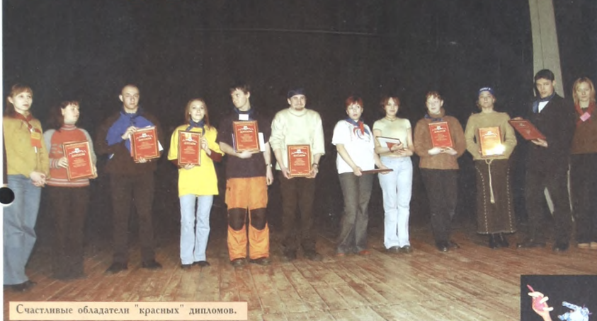
Счастливые обладатели "красных" дипломов.

всех разные интересы, многие по собственному желанию изучают английский язык, хоть для диплома это не требуется. Первый слет нам всем очень понравился и претензий к нему никаких нет. Настроение у всех отличное. Теперь будем стремиться оставаться лучшей группой, чтобы снова попасть в "Ребячку".