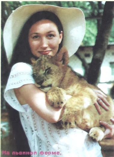
На львиной ферме.