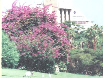
Сан-Сити. Отель «КАСКАД».

И я решил попытать счастья. Задача была не из легких, учитывая мое знание (вернее сказать, полное незнание) английского. Но дело осложняло не это, а то, что рядом с ней все время находился ее «мавр». Заметив мой интерес к его спутнице, он перехватывал мои взгляды,