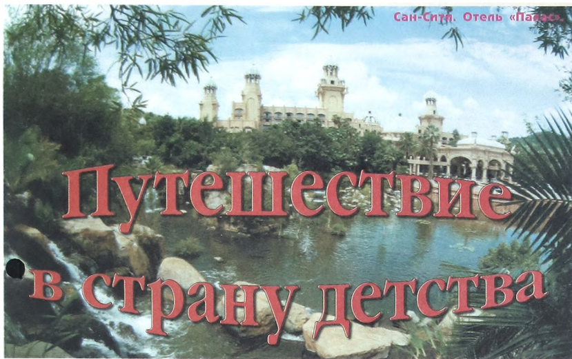
Сан-Сити. Отель «Палас»