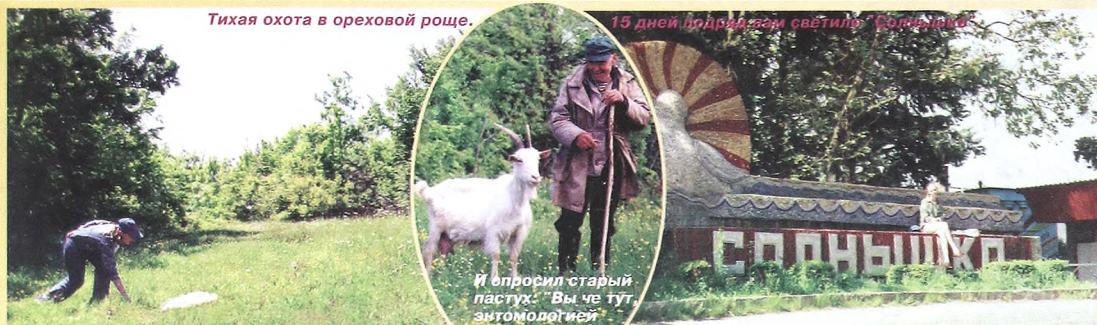
И спросил старый пастух: "Вы че тут, антомологией занимаетесь?"