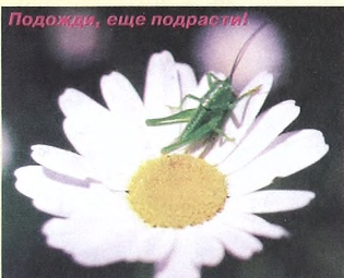
Подожги, еще подрастят!

камы на задних крыльях. Вероятно, здесь самка любилка откладывает яйца, и её ревнивый супруг яростно отгонял всех конкурентов, устранивая воздушные бои на уровне самых крутых голливудских