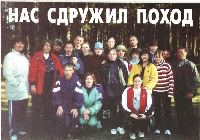
ТАБЛИЦА ПЕРЕВОДА РЕЗУЛЬТАТОВ ЦЕНТРАЛИЗОВАННОГО ТЕСТИРОВАНИЯ В ПЯТИБАЛЛЬНУЮ СИСТЕМУ В ТЮМЕНСКОМ ГОСУНИВЕРСИТЕТЕ В 2002 ГОДУ