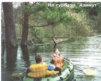
На турбазе "Азимут".

Утром нам предстоял долгий переход на турбазу, поэтому отбой получился ранний (в 22-00). Тяжелым и мучительным оказался подъем