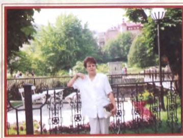
мы направим в рабочую группу. - Людмила Мильтоновна,