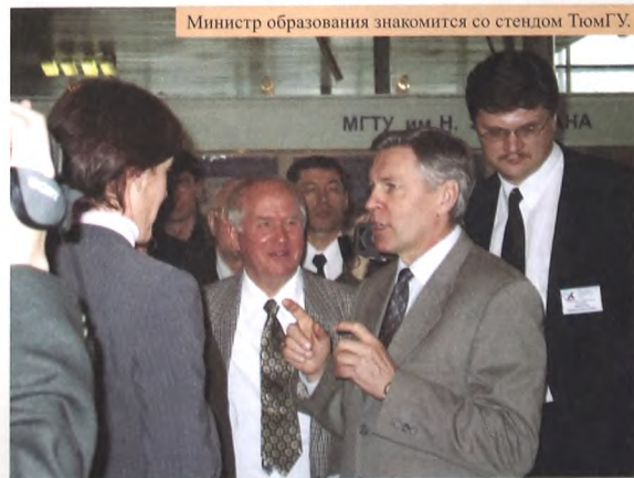
Министр образования знакомится со стендом ТюмГУ.