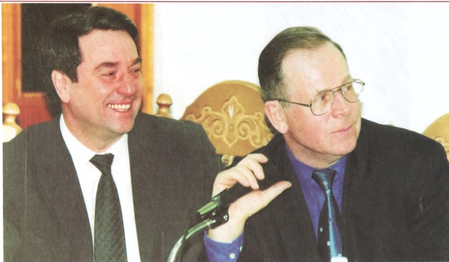
Приказ N 197

Институт государства и права за короткий срок своего существования занял ведущие позиции в сфере подготовки, переподготовки и повышения квалификации юридических и управленческих кадров. Сегодня Институт государства и права является динамично развивающимся подразделением Тюменского государственного университета. Коллективу преподавателей и сотрудников института удается соединить в единое целое высокий уровень преподавания, глубину научной работы, использование самых современных образовательных и информационных технологий. Успешное развитие института является одним из важнейших факторов успешного развития всего университета.