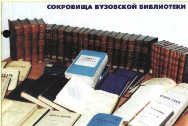
СОКРОВИЩА ВУЗОВСКОЙ БИБЛИОТЕКИ

- Что тебе в себе больше нравится? - Я уже сказала - чувствую юмора.