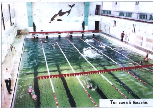
Тот самый бассейн.