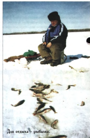
Для отдыха - рыбалка.