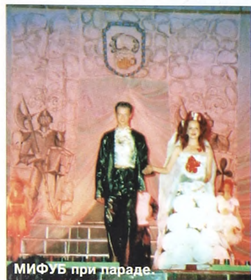
МИФУБ при параде

и основная задача его очень проста: показать, на что способны новобранцы первокурсники в творческом плане и, соответственно, посоревноваться в том, кто веселее и находчивее. А уж тут начинает происходить самое незабываемое: вытанки, мохаи, злодеи и клоуны, танцоры и певцы из рядов вновь прибывших в университет пытаются по максимуму в течение праздника развеселить публику. В итоге самым лучшим факультетским командам - дипломы и призы, менее удачливым - аплодисменты, свист и крики зала. Так что все вроде честно.