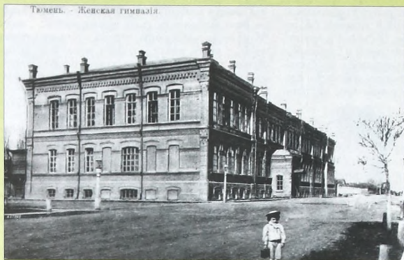
Тюмень. - Лицейская гимназия

интересно отметить, что в Тюмени большинство школ и других учебных заведений были построены не на государственные или общественные (т.е. из городского бюджета) деньги, а на деньги «спонсоров» - богатых купцов, желавших оставить свое имя в памяти потомков.