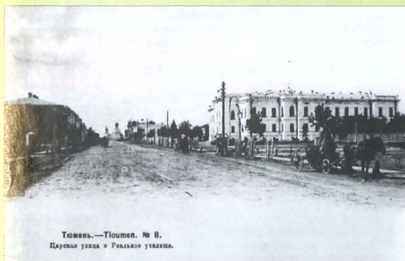
Тюмень. - Тюмень. № 6. Царская улица и Реальное училище.

5. Сколько лет было Ф.Тютчеву, когда он встретил свою «последнюю любовь» Е.А.Денисьеву?