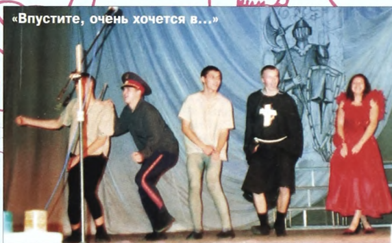
«Впустите, очень хочется в...»

Так чем же запомнился «Дебют» 2001 года в ТюмГУ? В первую, но не в последнюю очередь нехваткой билетов и ангажированностью зала, приятными ведущими и «кавыми» выступлениями. Весь груз ответственности открытия праздника в этом году «лег» на команду биологического факультета. «Академия благородных