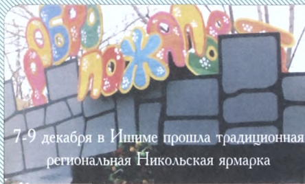
7-9 декабря в Ишиме прошла традиционная региональная Никольская ярмарка