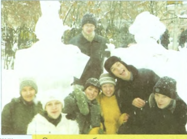
Зимние забавы гимназистов.

Прогулялись мы замечательно и даже уложились в график, то есть вернулись ровно в назначенный час. Вместе с «сонями» мы поучаствовали в играх, поболели за футболистов и отправились в корпус. Оказалось, что здесь так же интересно, и мы с девочками стали развлекаться. Знаете, как это классно: постучаться к кому-нибудь в дверь и убежать, чтоб никто не заметил! Или облить водой всех, кто есть в соседней комнате, и тоже убежать. Наверное, скажете, что развлекается как трехлетние дети? Ну и ладно! Быть всем взрослыми - это так скучно! Вдруг, выглянув в окно, мы увидели, что лес превратился в огромную снежную массу. Среди гимназистов разразилась «холодная война». Я надеюсь, что понятие, почему холодная? Минус пять на улице, плюс снежки, летящие в тебя со всех сторон. Все морские, но смеющиеся, счастливые, собирают остатки первого снега с еще зеленоватой травы и бросают его, не разбирая в кого,