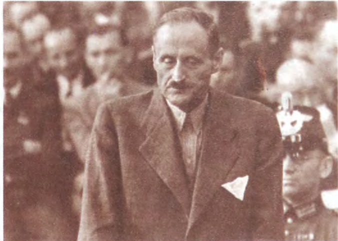
Под судом трибунала. Генерал Ульрих фон Хассель. Берлин. 1944 г.