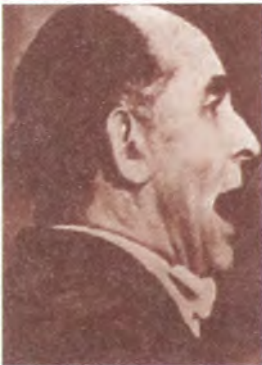
Р. Фрейслер: «...на виселицу!»

В 1925 г. Роланд Фрейслер вступил в национал-социалистическую немецкую рабочую партию (НСДАП), связав с ней свою жизнь. В 1932 г. он стал депутатом прусского ландтага от