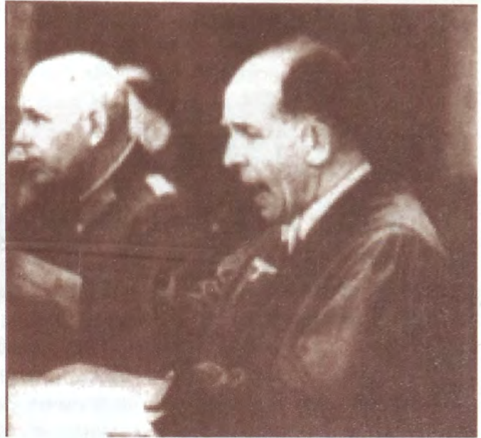
Р. Фрейслер за работой Берлин. 1944 г.

С 1942 г. Р. Фрейслер возглавил так называемый Народный трибунал. На этом посту он на практике применил опыт Советской России по ликвидации «старых большевиков» в отношении нацистов-отступников. Проницательный и хладнокровный, он был безжалостным судьей, отправляя на виселицу всех без исключения подсудимых — крупных коммунистических функционеров, фельдмаршалов, генералов и адмиралов. Особенно жестоким Фрейслер был по отношению к руководителям «Июльского заговора» 1944 г. Дело рассматривалось при отсутствии сторон, приговор выносился немедленно и обжалованию не подлежал. Зловещий Народный трибунал постановил душить струнами от пианино обвиняемых и вешать их на крюках для мясных туш на скотобойне. Все это зрелище по приказу Фрейслера снималось на киноплёнку и демонстрировалось А. Гитлеру. Всего по данному делу было арестовано 7 тыс. человек. Около 200 из них Фрейслер приговорил к смертной казни 5 . Конец Фрейслера соответствовал библейскому изречению — «не судите, да несудимы будете». 3 февраля 1945 г. председательствуя в очередном суде над изменниками, Р. Фрейслер был убит прямым попаданием бомбы союзников.