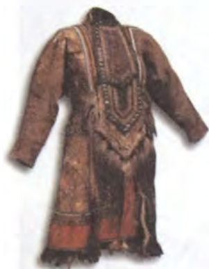
Тунгусский костюм из коллекции И. Я. Словцова