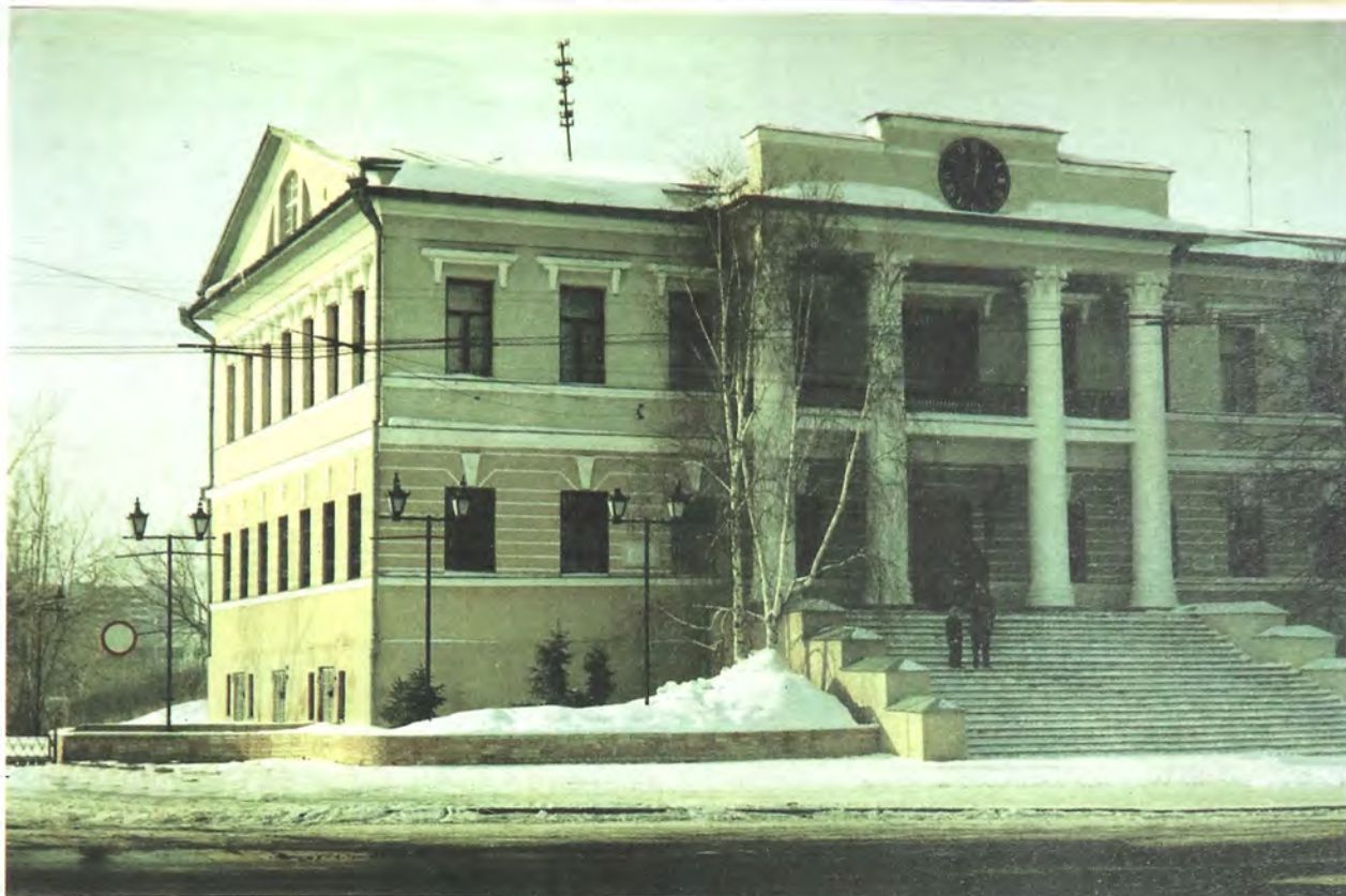
Музей «Городская дума» Тюменского областного краеведческого музея

зей отдельное здание не было, Дума посчитала наиболее приемлемым отдать под музей часть здания каменного Гостиного двора. Надо отметить, что большинство общественных учреждений Тюмени не имели собственных помещений и размещались во временных, как «Пушкинская» городская публичная библиотека. Кроме того, городу настоятельно требовалась квартира для сессий окружного суда. В это время, после строительства Торговых рядов освобождался Гостиный двор, и, по мнению городских властей, следовало оба этих научно-воспитательных учреждения (библиотеку и музей), добавив к ним квартиру для сессий окружного суда, разместить в одном месте. Как мыслилось устроителям, это будет «представлять для публики весьма существенное удобство» 16 .