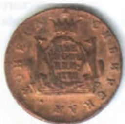
Сибирская монета 1772 г. из коллекции Н. М. Чукмалдина