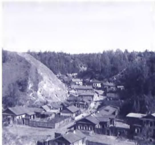
Местечко Вершина у г. Тобольска 1912

Работали за трудодни. Вначале рассчитывали за трудодни ежедневно. Ходили получать когда тарелку муки, когда крупы — что колхоз доставал для прокормления колхозников.