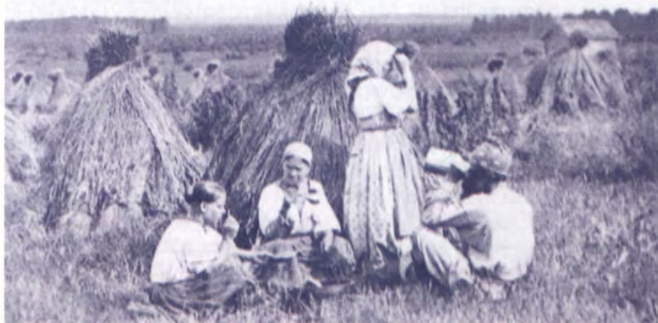
Крестьяне в поле. Обед. 1912 Фото С. М. Прокудина-Горского

Сжатый хлеб осенью не молотили. Сухие снопы укладывали в «клади» (скирды) и укрывали прошлогодней соломой от непогоды. Ставили скирды не на землю, а на настилы, поднятые над землей на столбиках примерно на полметра, чтоб под клади не подрывались свиньи и не заводились мыши. Настил делали из жердей, по ним стелили рогожи, старую солому. Перед обмолом снопы сушили на овинах, особенно рожь: она без сушки плохо вымолачивалась под цепом. Пшеница в мороз хорошо обмолачивалась и без сушки.