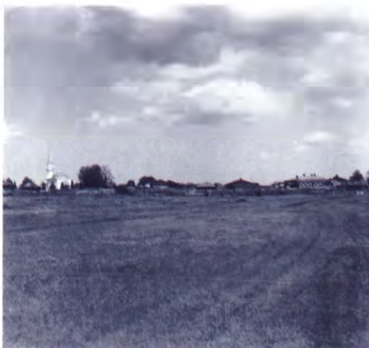
Ембаевские юрты близ Тюмени 1912