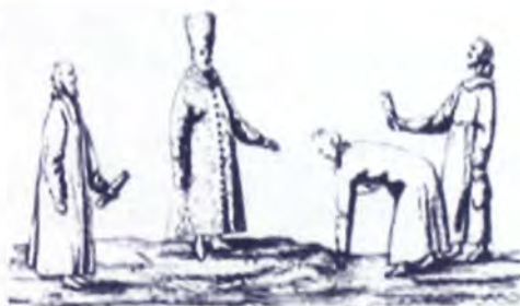
Рис. XVII в.