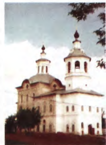
Ишим Богоявленский собор

Тобольская полицейская и основанная на ней губернаторская «политическая аналитика» представляет собой любопытнейшие документы эпохи. Но интересны они не только и не столько анализом состояния провинциального рос-