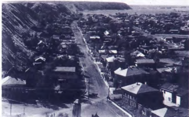
Вид на Тобольск с Успенской церкви. 1912 г.

Таковой виделась уездным исправникам и губернатору политическая жизнь населения Тобольской губернии в преддверии событий, положивших конец самодержавию.