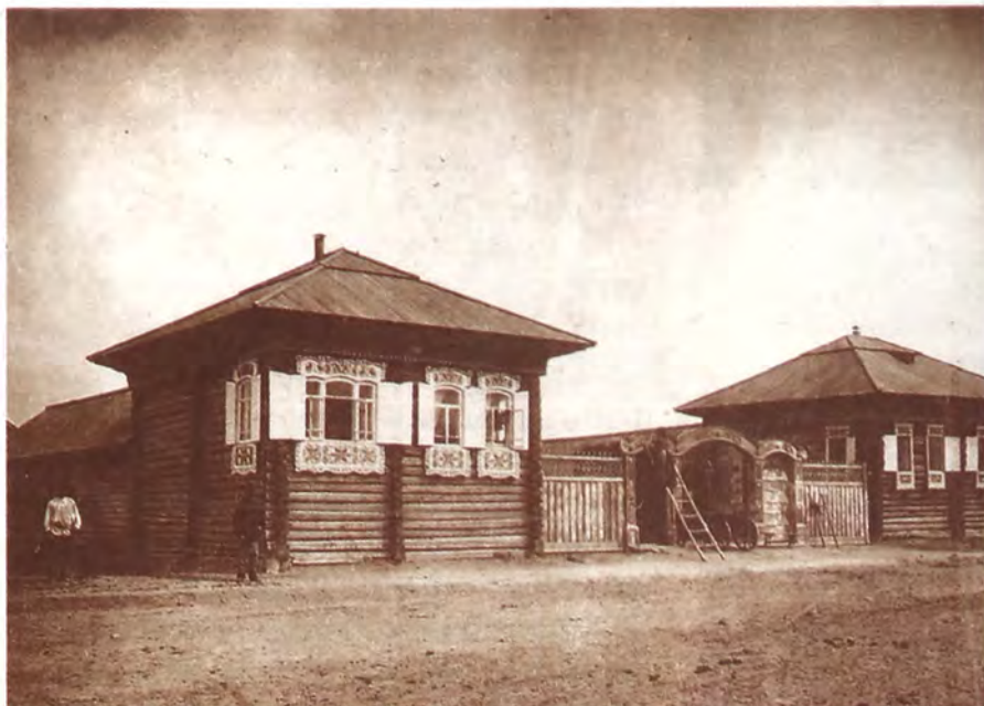
Улица в сибирской деревне. Конец XIX в.

Переселенцы в первые годы строили избу в виде рубленой квадратной клетки из бревен длиной 7 аршин — «семерик», затем некоторые мужики со временем добавляли еще клеть, т. е. ставили от первой на рас-