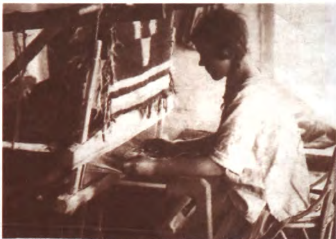
Крестьянка за ткацким станком. 1929 г.

В деревне за огородами были расположены родовые участки по подготовке лесоматериалов для хозяйственного строительства. Здесь были установлены «пильни» для ручной распиловки леса различного назначения: досок, теса, плах, бруса и т. д. Здесь же на участках кантовали (отесывали) бревна, рубили срубы на дома, стаи, бани. Все это делали в специальном месте и не допускали загрязнения улиц и своих дворов. По чистоте в деревне порядок был строгий.