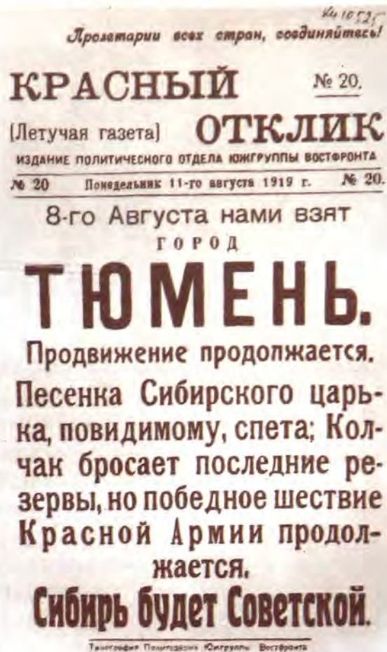
Листовка об освобождении Тюмени от колчаковцев