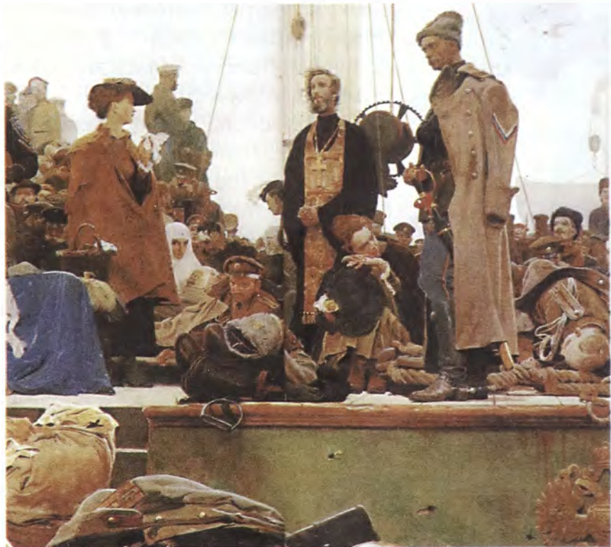
Д. Белокин. Белая Россия. Исход (фрагмент)

На территории, контролируемой Временным Сибирским правительством, была разрешена легальная деятельность всех политических партий, кроме большевистской, профсоюзов, различных союзов и товарищеских обществ. В архивных документах сохранился список союзов и профессиональных обществ, входящих в Тюменское Центральное Бюро профессиональных союзов, с расположением их представительств 18 .