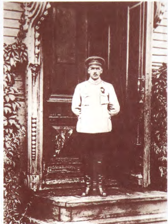
Командир Василий Блюхер в Тюмени

Красные войска появились в Тюмени к вечеру 8 августа. Это были части вновь созданной в начале июля 1919 г. 51-й стрелковой дивизии, командиром которой был назначен