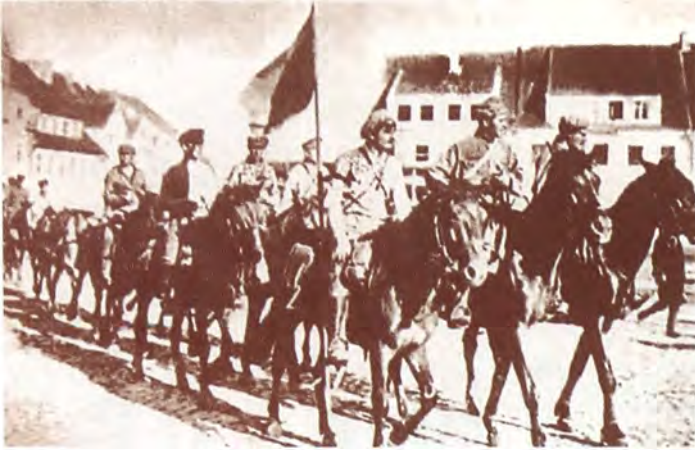
Красные входят в город

деятельность по формированию отрядов Красной армии. В госархиве отложился большой массив документов о создании отрядов, их численности, вооружении, обмундировании 4 .