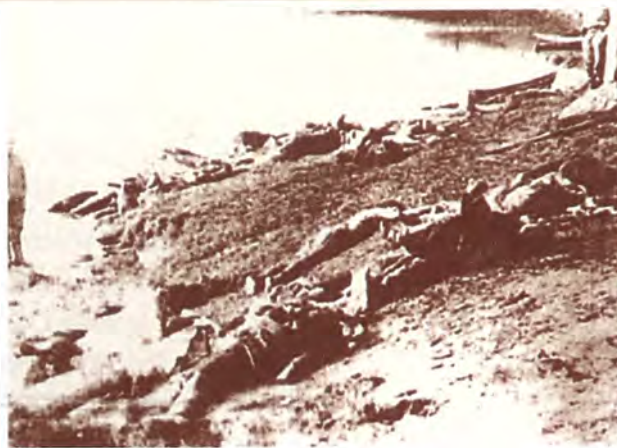
Жертвы красного террора

20 июля 1918 г. белогвардейцы вступили в Тюмень. Современники оставили самые разные, порой, взаимоисключающие оценки вступления в Тюмень чехов и белых. Военные корреспонденты тобольских газет писали о радости и торжестве горожан. Белогвардейцы, опубликовавшие впоследствии мемуары, напротив, отмечали, что город не встретил своих освободителей рукоплесканиями и овациями. Население отнеслось к приходу белых довольно сдержанно. Оставшихся в городе работников советских учреждений, членов семей эвакуированных большевиков и им сочувствовавших арестовали. Очевидец рассказывал, что «потом наших товарищей разбили на 2 партии